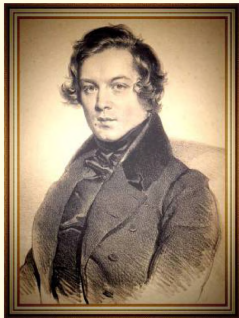
Роберт Шуман (1810-1856)

«Завтра примусь я за сборник миниатюрных пьес для детей... Я хочу сделать целый ряд маленьких отрывков безусловной легкости и с заманчивыми для детей заглавиями как у Шумана».